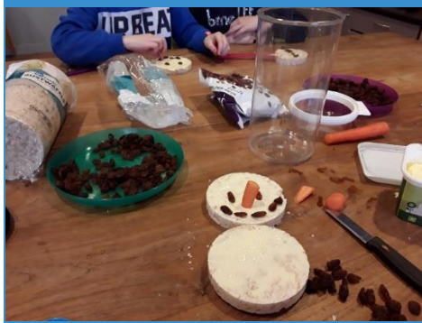
Zelf sneeuwpoppen maken van rijstwafels.